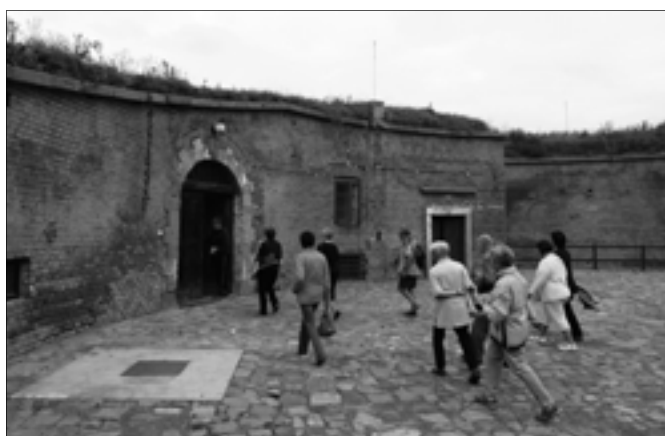
Zase poznáme některá tajemná místa Olomouce jako loni v říjnu fort č. XXII u Černovíra.

27. června – Objevování zmizelých míst Olomouce pod vedením doc. PhDr. Milady Pískové, sekce historická. Sraz ve 14 hodin před vchodem do chrámu sv. Václava (dómu).